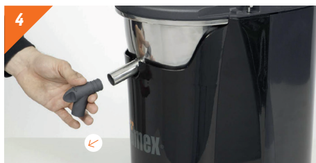
4 Smontare il rubinetto tirandolo verso l'esterno.