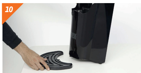
10 Tirare leggermente la vaschetta raccogli-gocce verso l'esterno.