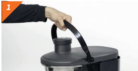
1 Alzare il manico di sicurezza

Per mantenere delle condizioni igienico-sanitarie ottimali, Zumex raccomanda di pulire la macchina minimo 1 o 2 volte al giorno , a seconda dell'uso.