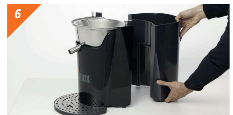
6 Smontare la vaschetta bucce tirandola orizzontalmente verso l'esterno.