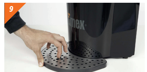
9 Smontare la vaschetta raccogli-gocce inserendo il dito indice in uno dei fori centrali del pezzo di acciaio e tirando verso l'alto.