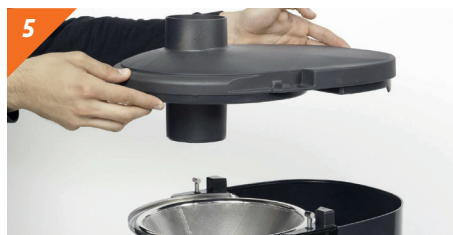
5 Rimuovere il coperchio