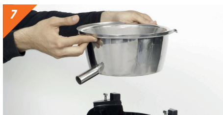
7 Smontare la vaschetta succo e il filtro di acciaio inossidabile tirandola verso l'alto in posizione verticale.