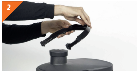
2 Rimuovere il manico mettendolo in posizione orizzontale e spingendo verso la parte opposta.