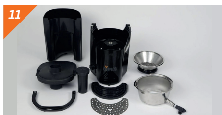
11 Pulire con cura tutti i componenti.