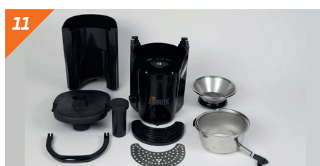
11 Nettoyer les pièces.