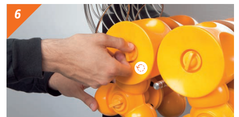
6 Allentare le manopole di fissaggio delle unità di spremitura.