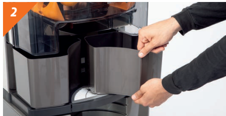
2 Estrarre i contenitori (convogliatori nel modello Podium) delle bucce.