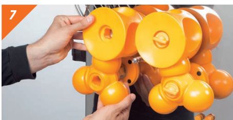
7 Togliere le unità di spremitura a coppie.