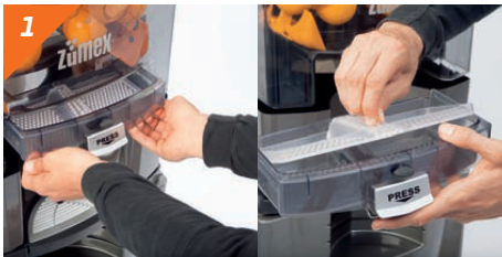
1 Estrarre il vassoio succo e il filtro. Fare attenzione a non perdere il filtro.

Attenzione! Per un corretto processo di pulizia si prega di seguire le istruzioni sotto riportate. Assicurarsi che la macchina sia scollegata dalla corrente elettrica.