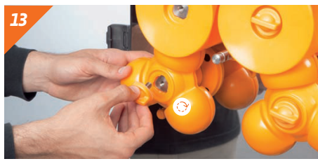
13 Fissare le manopole e serrare bene. Le manopole mancanti devono essere sostituiti immediatamente. Non utilizzare mai la macchina qualora manchi una manopola di fissaggio.