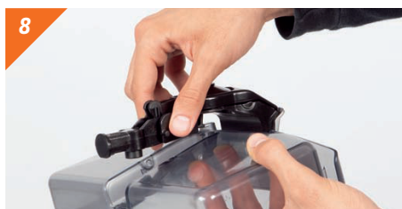
8 Rimuovere il rubinetto.