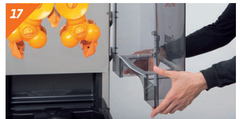
17 Posizionare il coperchio frontale.