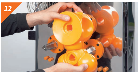
12 Montare le unità di spremitura per coppie.

Per riassemblare la macchina ripetere con attenzione esattamente il processo inverso e la macchina è pronta per lavorare.