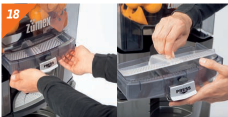
18 Inserire il vassoio succo e il filtro.