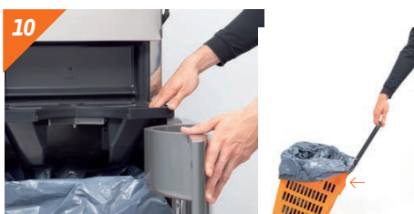
10 In caso di modelli Podium, pulire lo scivolo e l'interno del carrello per eliminare ogni traccia di buccia e polpa.