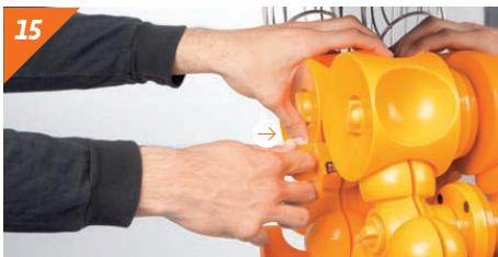
15 Posizionare il coltello. Spingere fino a quando non scatta in posizione con un "clic".