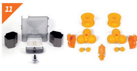
11 Sostituire i pezzi smontati con i pezzi del kit di pulizia (qualora disponibile) o con i componenti puliti.