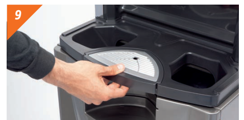
9 Togliere il vassoio portabicchieri e il filtro.