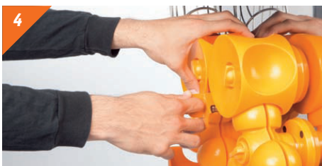
4 Estrarre il coltello tirandolo verso di voi. ATTENZIONE! La lama è molto affilata, fare attenzione a non tagliarsi.